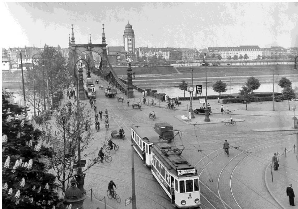
Die Friedrichsbrücke im Jahr 1936