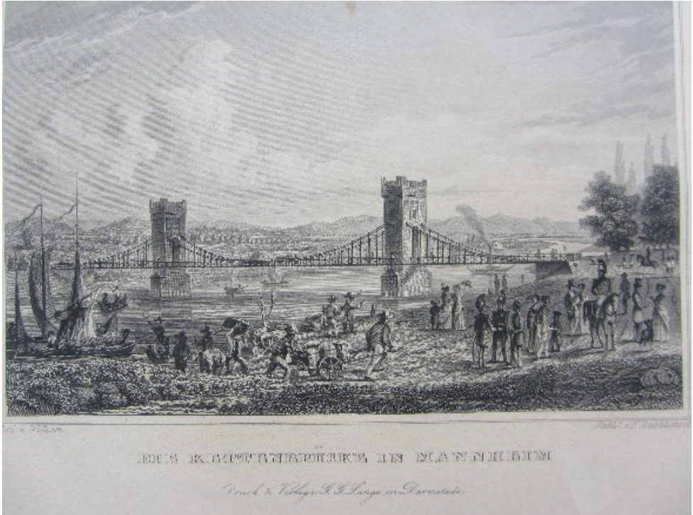
Kupferstich der Kettenbrücke im Jahr 1850

Als Mannheim Ende des 18. Jahrhunderts durch den Wegzug des Kurfürsten nach München keine Residenzstadt mehr war und wenig später durch Auflösung der Kurpfalz den Status als Hauptstadt verlor, begann der wirtschaftliche Abstieg. Die nachfolgenden Koalitionskriege (1792-1815) mit allen Belastungen verhinderten jede wirtschaftliche Erholung. Doch als Napoleons Armeen endgültig besiegt waren, konnte sich die Stadt langsam weiterentwickeln. Vor allem die weitsichtigen Investitionen in die Infrastruktur halfen der Stadt. 1834 wurde am Rhein der Grundstein zum neuen Freihafen gelegt, die feierliche Einweihung erfolgte 1840. Im selben Jahr entstand der erste Bahnhof, damals vor den